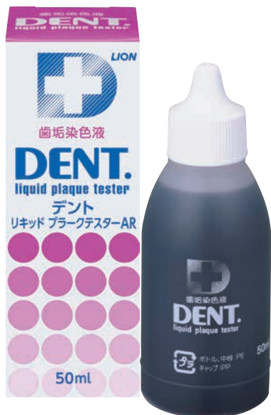
DENT.リキッドプラークテスター(50ml) メーカー希望 患者様向け価格/個(税抜) 1,100円