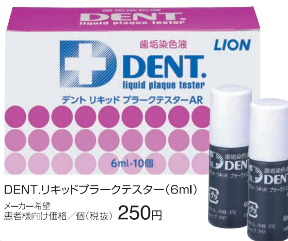
DENT.リキッドプラークテスター(6ml) メーカー希望 患者様向け価格/個(税抜) 250円