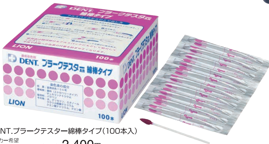
DENT.プラークテスター綿棒タイプ(100本入) メーカー希望 患者様向け価格/個(税抜) 2,400円

予め染色部位の水分を少なくしてから液(または、綿棒の綿球部分)をしっかりと観察部位にあてていただくほか、塗布後の口すすぎの水量や回数を出来るだけ少なめにさせていただくと、しっかり染色しやすくなります。