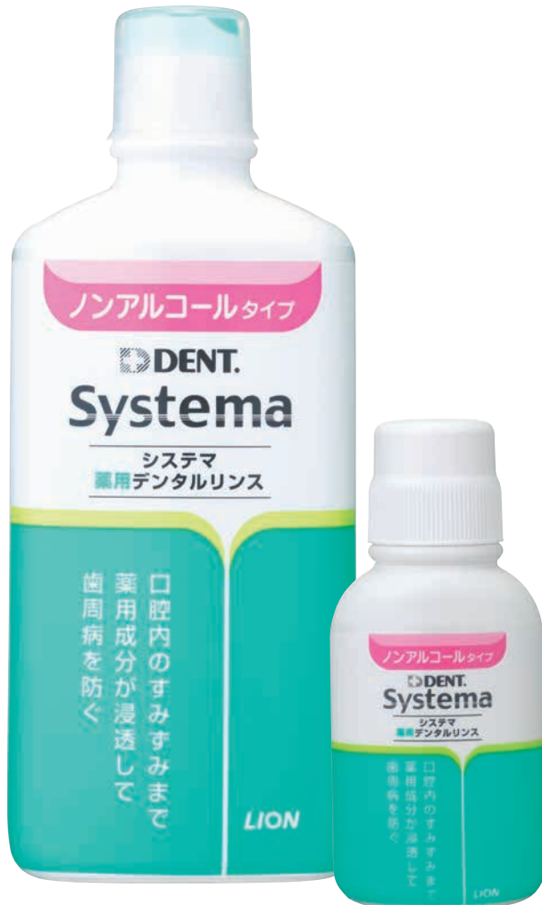
ノンアルコールタイプ (450ml/80ml)