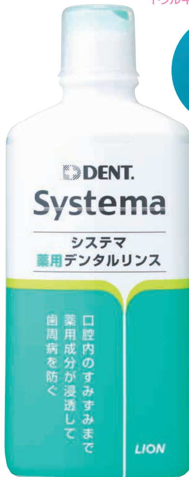
レギュラータイプ (450ml)