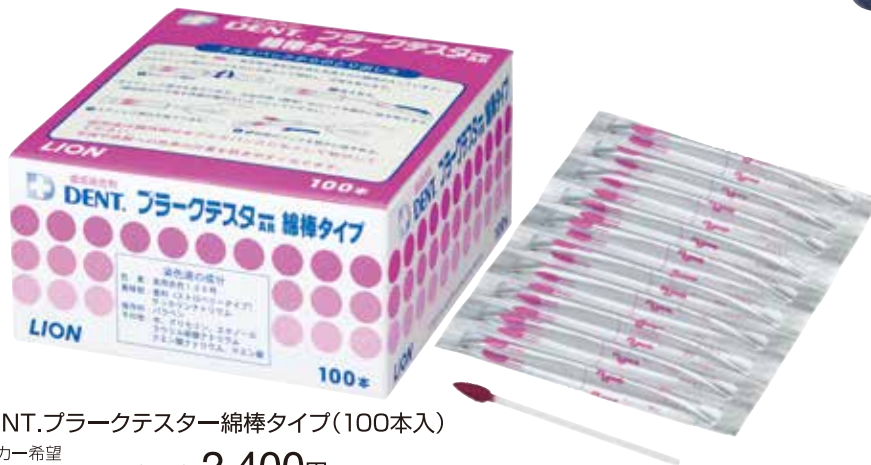
DENT.プラークテスター綿棒タイプ(100本入)