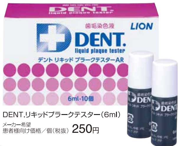
DENT.リキッドプラークテスター(6ml)