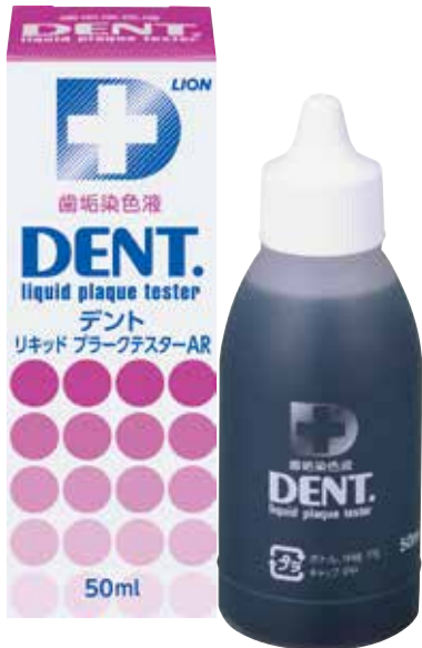
DENT.リキッドプラークテスター(50ml)