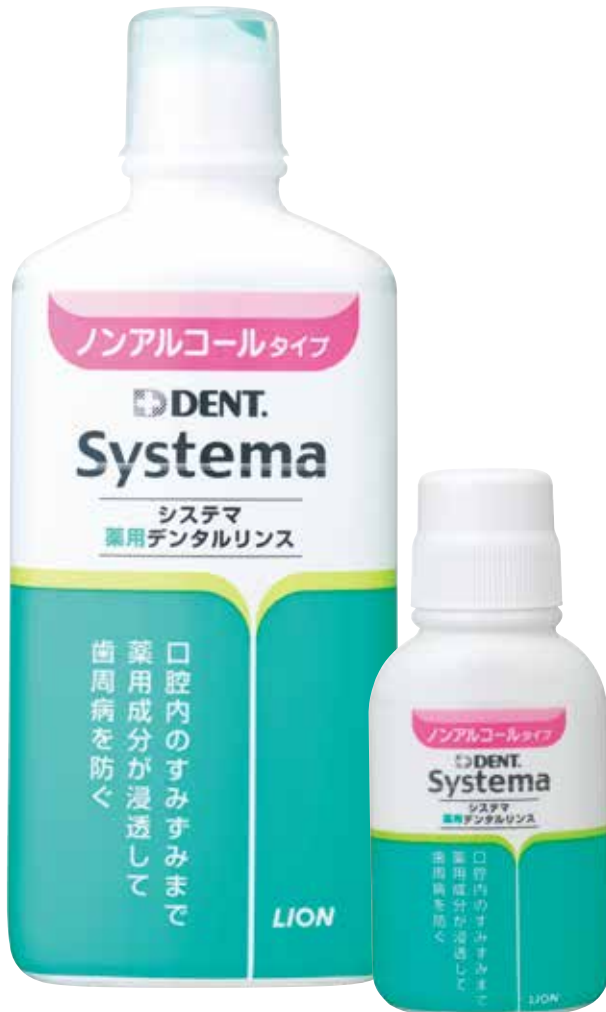
ノンアルコールタイプ (450ml/80ml)