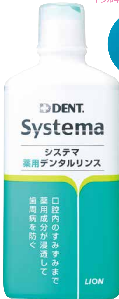
レギュラータイプ (450ml)