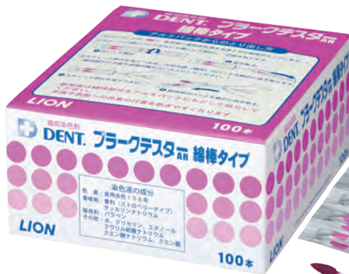
DENT.プラークテスター綿棒タイプ(100本入)