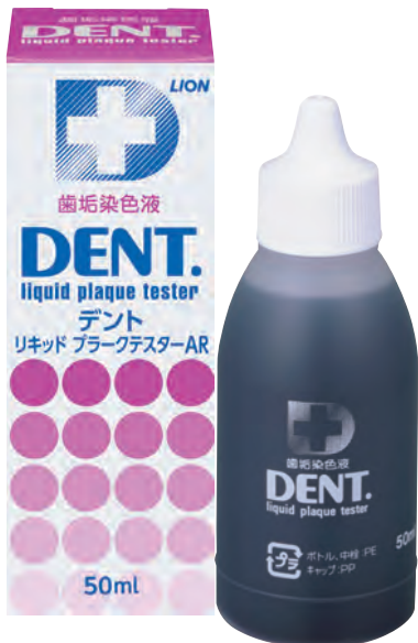
DENT.リキッドプラークテスター(50ml)