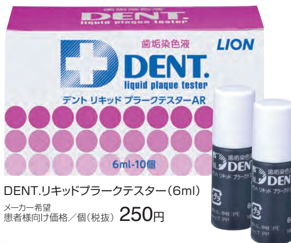
DENT.リキッドプラークテスター(6ml)