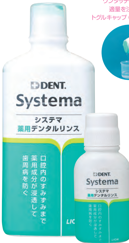
レギュラータイプ (450ml/80ml)

ワンタッチで開閉でき、 適量を注ぎやすい トグルキャップ (450mlサイズ)。