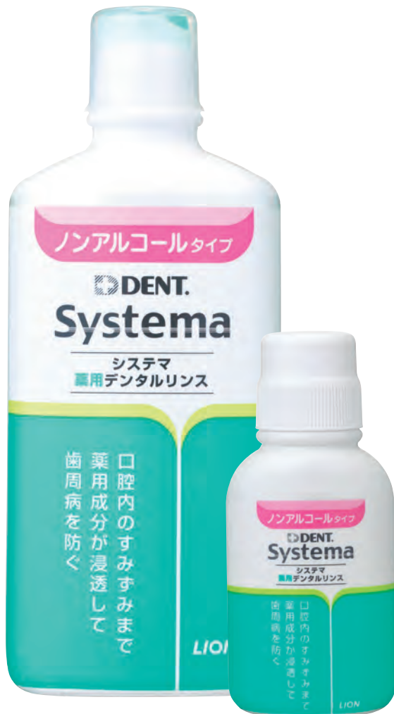
ノンアルコールタイプ (450ml/80ml)

販売名：デント・システムデンタルリンスNa (ノンアルコールタイプ) デント・システムデンタルリンスa (レギュラータイプ)