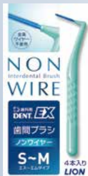
DENT. EX 歯間ブラシ NON WIRE S~M (4本入、各携帯用キャップ付)