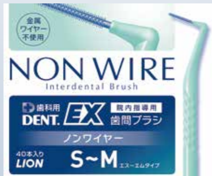
DENT. EX 歯間ブラシ NON WIRE 院内指導用 S~M (40本入、各携帯用キャップ付き)