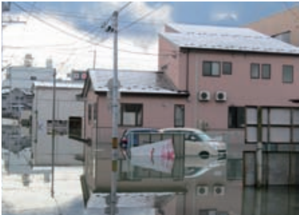
震災翌日、水没した歯科医院(上)と現在の様子(下)