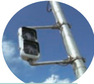
止まったままの信号も所々に