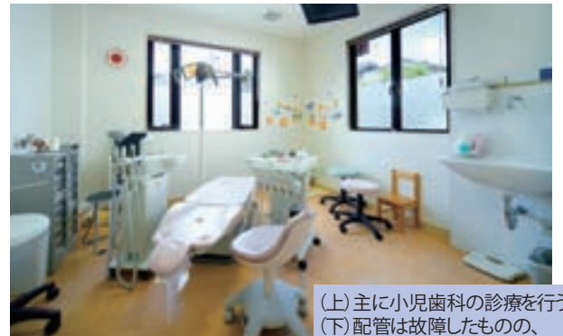
(上)主に小児歯科の診療を行う個室 (下)配管は故障したものの、ユニットはかろうじて無事だった

「まだ3年目ですし、同じスタッフで再開できるわけですから、震災があったからといって急に意識が変わるということはありません。これからもみんなで話し合いながら、理想の『こぐえ歯科クリニック』を築き上げていきたいと思えます」（院長）。