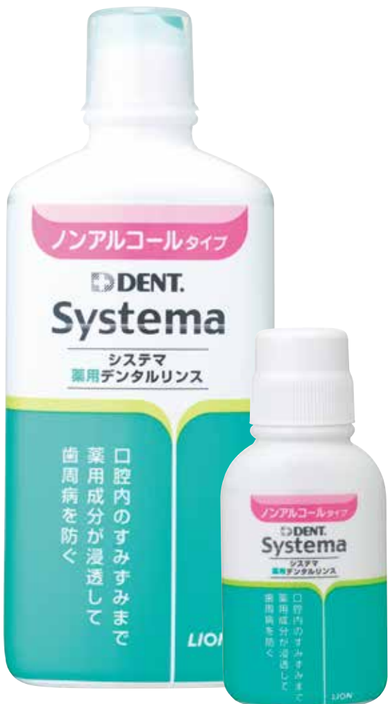
ノンアルコールタイプ (450ml/80ml)

販売名：デント・システムデンタルリンスNa (ノンアルコールタイプ) デント・システムデンタルリンスa (レギュラータイプ)